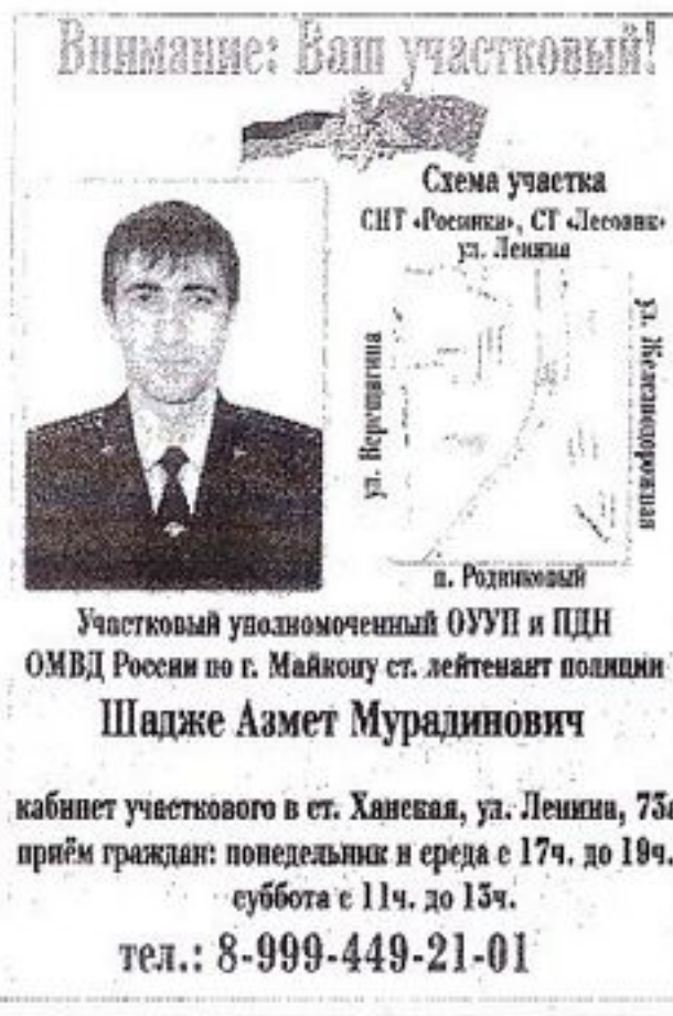
ГРАФИК ПРИЕМА ГРАЖДАН УЧАСТКОВЫМИ УПОЛНОМОЧЕННЫМИ ОТДЕЛА МВД РОССИИ ПО Г. МАЙКОПУ

ПОНЕДЕЛЬНИК с 17.00 ДО 19.00 СРЕДА с 17.00 ДО 19.00 СУББОТА с 11.00 ДО 13.00